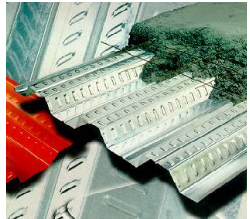
Tabla de pesos y espesores